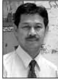
Oleh : Iwan Sabatini

Terkait dengan pelaksanaan ACFTA (Asia – China Free Trade Area) khususnya di lingkungan PT. Pelabuhan Indonesia III (Persero), maka berdasarkan pengamatan arus barang impor / ekspor pada beberapa pelabuhan utama seperti Tg. Perak – Surabaya , PT. TPS – Surabaya, dan TPKS-Semarang dapat disimpulkan tidak terdapat lonjakan peningkatan arus import dan ekport ke/dari China, dengan penjelasan sebagai berikut :